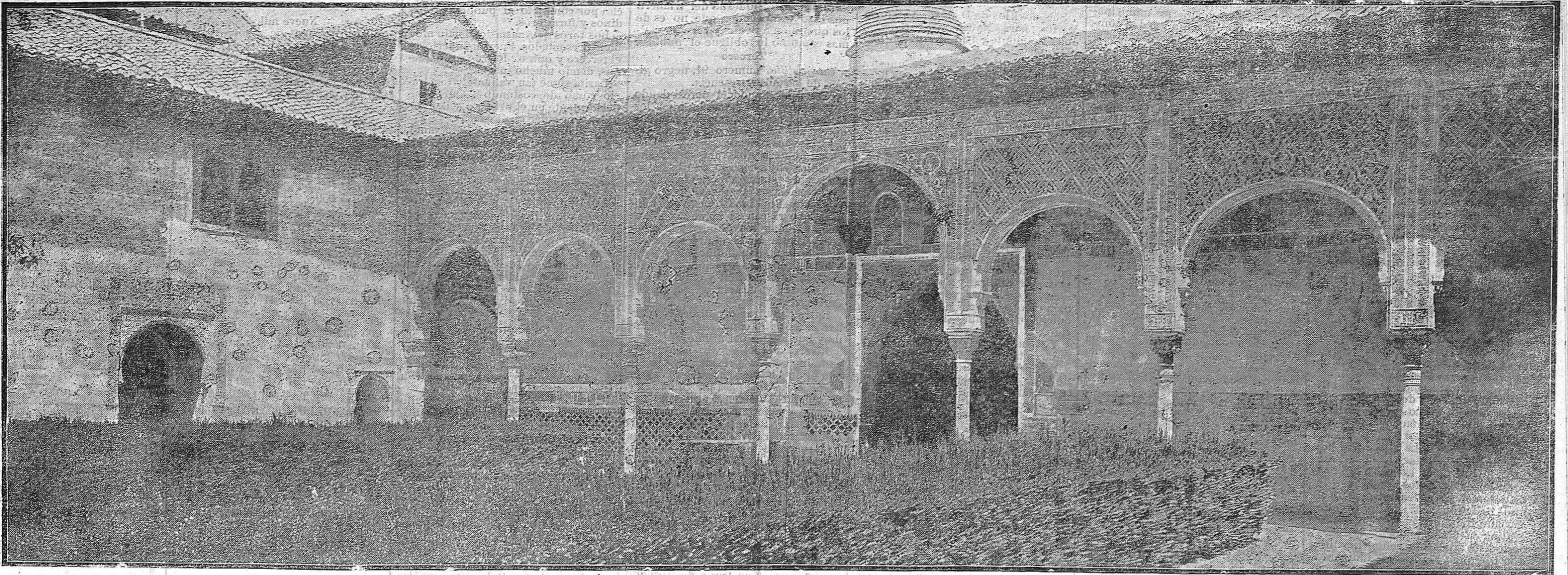
Palacio árabe.—Pórticos de la sala de la B