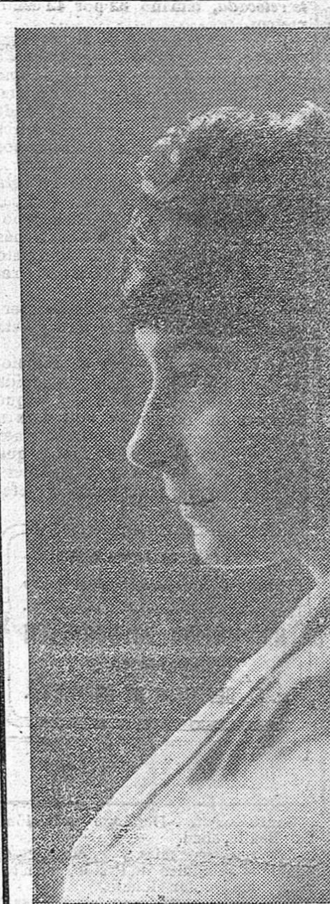
MARGARITA XIRGU La estrella de mayor magnitud que brilla actualmente en la escena española y que se despide esta noche del público granadino.

prendemos que de seguir en la actitud en que hasta aquí hemos estado, comentando nuestras faltas en familia, y no en público, como acto de protesta, lo significaría al Gobierno, que Granada estaba conforme con su situación de hambre y paro, dando así una muestra firme e irrefutable de mansedumbre y eslavitud, aboildada ya hasta en los países que se consideraban sus hombres más atrasados e incultos que en España, y como creemos que en Granada no pue-