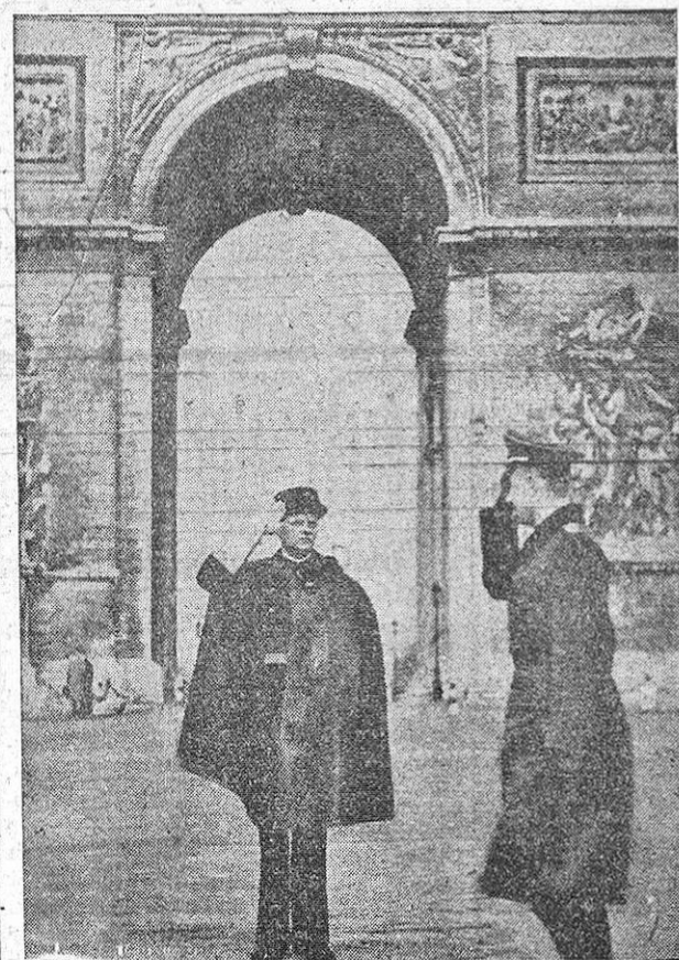
Como un símbolo, frente al Arco del Triunfo, un policía parisién saluda rigidamente a un oficial alemán, que contesta con toda marcialidad.