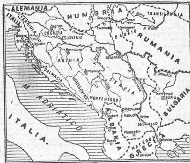
Mapa de Yugoslavia en el que se señalan los antiguos reinos que la componen, y su extensa frontera con países firmantes del pacto tripartito.

Budapest, 29.—Radio Belgrado anuncia que ha sido proclamado el estado de sitio en Yugoslavia. Esta medida ha sido además anunciada por medio de carteles en la vía pública. La emisora de la capital yugoslava ha invitado a la población a seguir las órdenes del Ejército, con objeto de impedir a los elementos extranjeros que aprovechen la situación para perturbar el orden interior.—Efe.