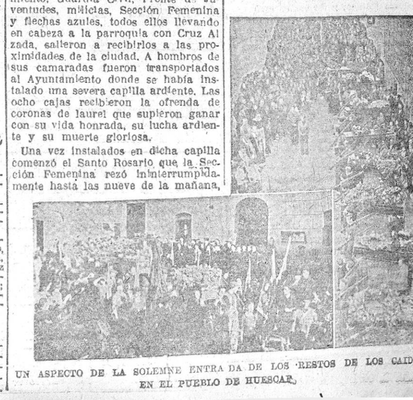
UN ASPECTO DE LA SOLEMNE ENTERRADA DE LOS RESTOS DE LOS CAIDOS EN EL PUEBLO DE HUESCAR.

Una vez instalados en dicha capilla comenzó el Santo Rosario que la Sección Femenina rezó ininterrumpidamente hasta las nueve de la mañana,