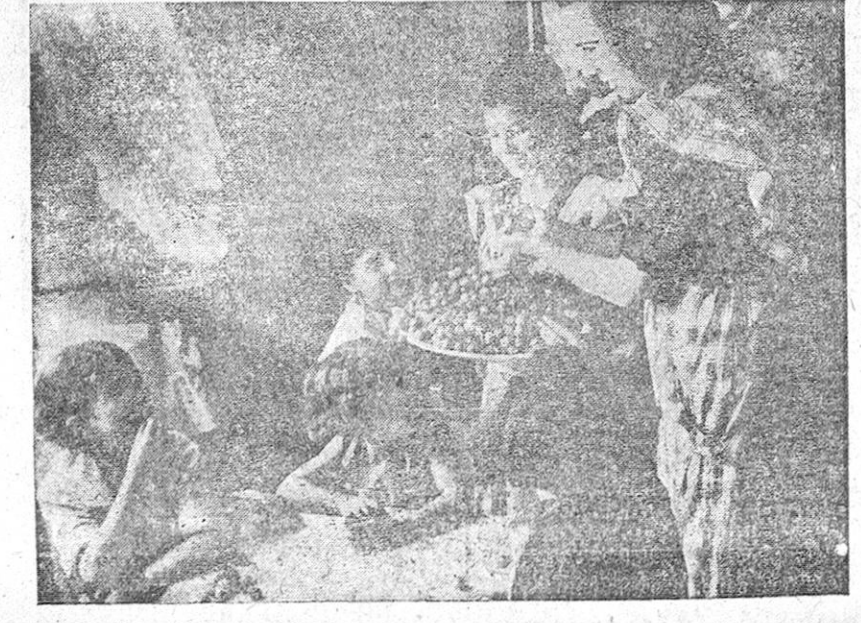
Estos niños jubilosos, expresan con su contento lo que para ellos representa la institución de Auxilio Social.