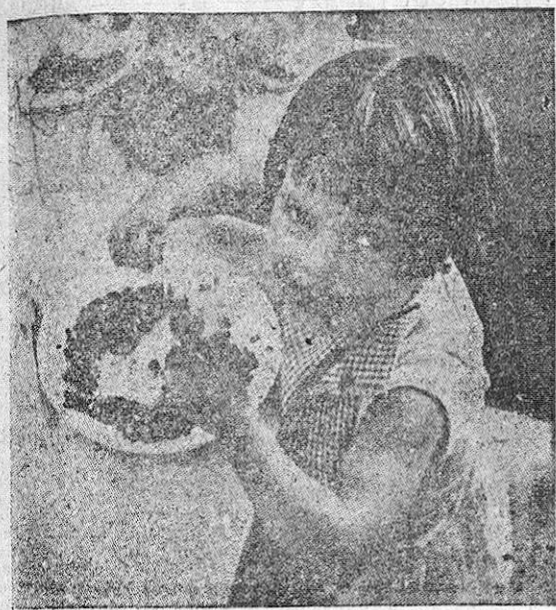
Este pequeño beneficiario recibe con la alegría de sus pocos años la comida, fiel reflejo de la solidaridad que otros españoles le brindan.