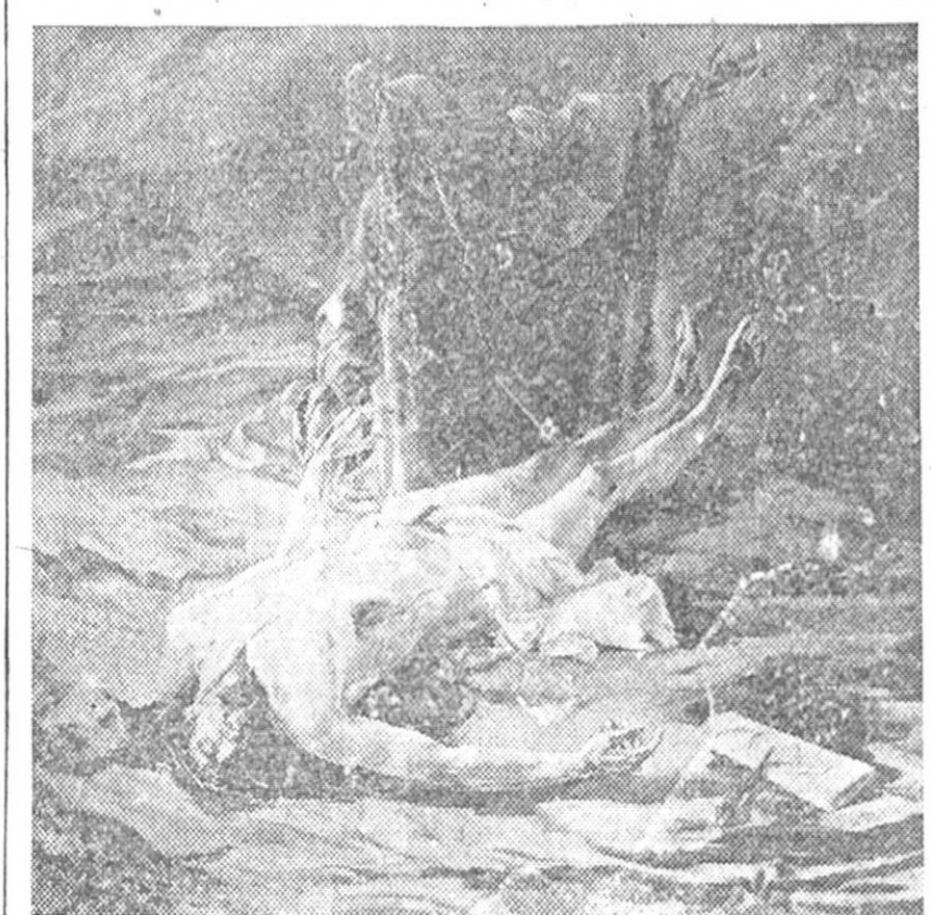
El laureado pintor granadino Manolo Maldonado, dibujante de PATRIA, ha enviado a la Exposición nacional de Bellas Artes, de Madrid, dos bellos cuadros, en los cuales supera su anterior obra pictórica. Reproducimos aquí «La quinta angustia», obra ésta la mejor conseguida y de mas altos vuelos del artista, tratado con una concepción del tema personalísimo, dándole a la tragedia toda su hondura trágica y emotividad exacta. El cielo y la tierra, se funden en tonos sombríos, prestándole más patetismo a la pálida y rígida figura de Cristo, dibujando la grave estampa de la Virgen, que aparece con un gesto de dolor, que sólo la pintura es capaz de expresar con fidelidad. El otro cuadro de Maldonado es un paisaje de Toledo, magníficamente llevado al lienzo.