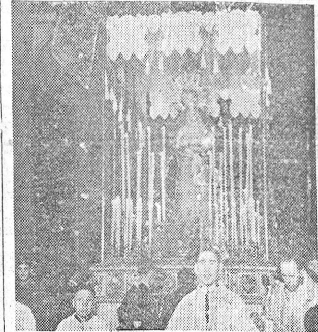
Los "pasos" del Via Crucis, Soledad de Nuestra Señora y Virgen de las Maravillas, durante su desfile procesional de anoche.