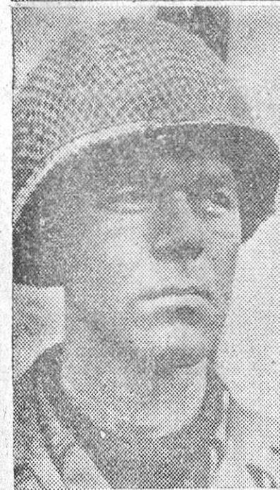
Arriba: el mariscal Kesséling, que ha sustituido a von Rundstedt en el mando de los ejércitos alemanes del Oeste.— Debajo: el general norteamericano Karl H. Timmermann, del primer Ejército, que dirigió el cruce del Rin y estableció la cabeza de puente de Remagen.