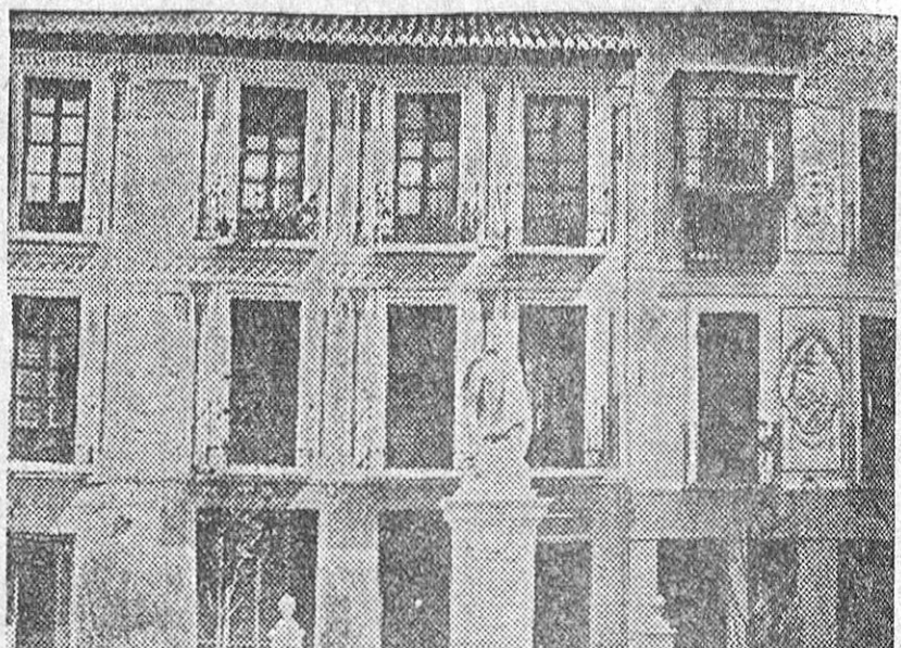
Bella perspectiva que ofrece la plaza de Alonso Cano (antes del Palacio Arsohpa), en uno de cuyos laterales se alza la magnífica estatua, obra del escultor señor Cano Correa, que perpetúa la memoria del genial pintor, escultor y arquitecto, preclaro hijo de Granada. Sirve de fondo al monumento la fachada de una casa que ha sido decorada con simuladas cornisas, rosetones y columnas, a todo color, que imprimen al lugar un carácter netamente granadino, a la vez que procuran el contraste de matices, con relación a la masa de piedra gris de la efigie. La plaza ha sido también pavimentada con grandes losas de piedra y para dar una solución al desnivel que existía con la calle de Libreros, se ha construido un largo basamento que interrumpe la explanación y en cuyos extremos se han construido dos pequeñas escalinatas de acceso.