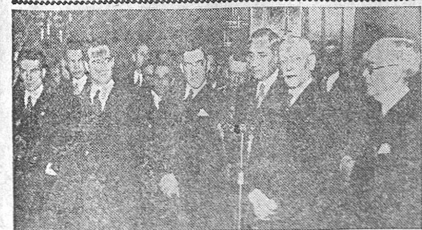
El presidente de la República portuguesa, general Carmona, y el jefe del Gobierno, doctor Oliveira Salazar, reciben a las delegaciones de todo el país que acudieron a expresarle la gratitud nacional por haber salvado de la guerra al pueblo lusitano.—(Foto CIFRA).

No quieren tener incidentes con los yugoslavos