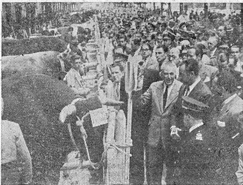
Ayer mañana, el ministro de Agricultura, camarada Miguel Primo de Rivera, clausuró el Concurso-Exposición provincial de ganados que se ha celebrado con el mayor éxito en el paseo del Salón.