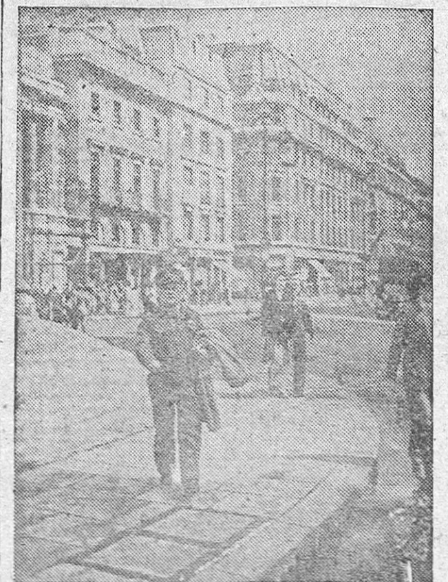
El general Rees, jefe de la diecinueve División india que opera en el frente birmano y que capturó la importante ciudad de Mandalay, pasa por una de las calles de Londres durante su reciente visita a la capital británica.