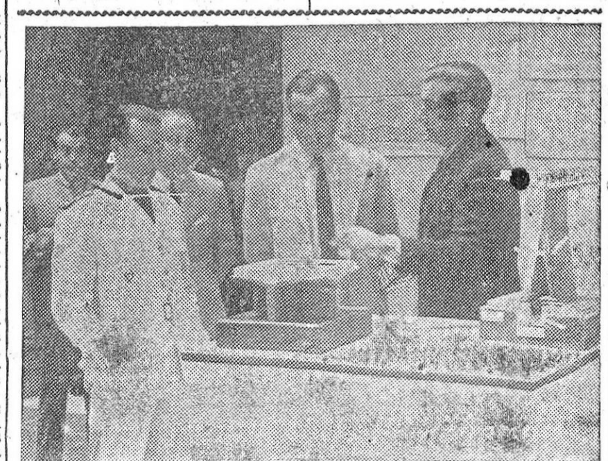
El ministro de Agricultura preside la inauguración de la Exposición de Proyectos de Almacenes reguladores de aceite para el Sindicato del Olivo.—(Foto CIFRA).

omitaba la evasión a España de prisioneros, aviadores y patriotas franceses perseguidos por los alemanes. El dueño de un hotel condujo a docenas cincuenta personas hasta la frontera de España, a través de un estrecho túnel que partía de una de las habitaciones del hotel, cuando éste se hallaba ocupado por los alemanes.—(EFE).