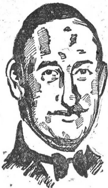
SIR VICTOR MALLET

S. E. el Caudillo, al que acompañaban el jefe de la Casa Militar, el teniente general Moscardó, y el segundo jefe de la misma, general Franco Salgado, recibió a nuevo embajador en la sala de costumbre, en presencia del ministro de Asuntos Exteriores, señor Martín Artajo; después de haber entregado sus cartas credenciales a Su Excelencia, éste pasó a conversar con el señor Víctor Mallet y el ministro de Asuntos Exteriores en un salón íntimo. (Pasa a la página segunda.)