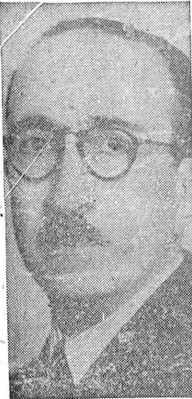
El nuevo presidente de la República del Perú, don José Luis Bustamante y Rivero, que hoy comienza su mandato.