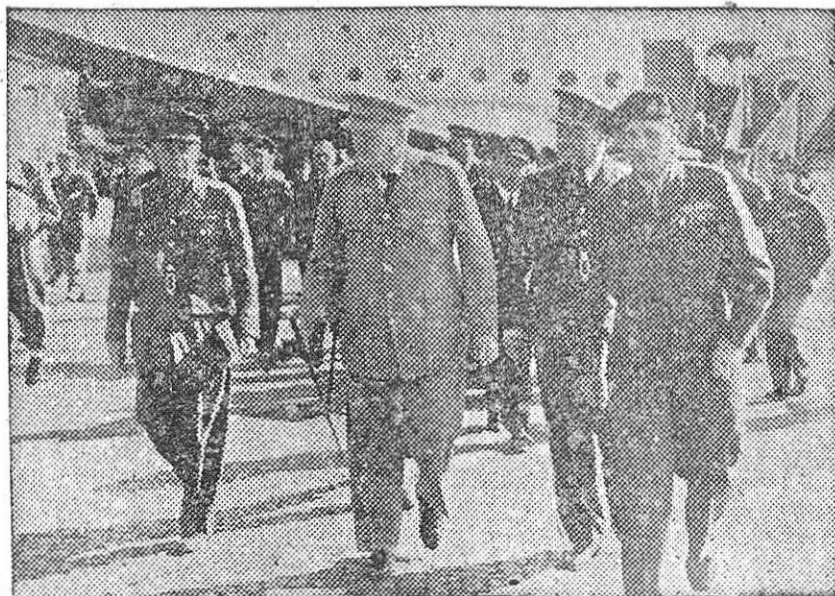
Mr. Churchill y el mariscal Montgomery pasan revista a las fuerzas que les rindieron honores a la llegada del "primer" a Berlín.