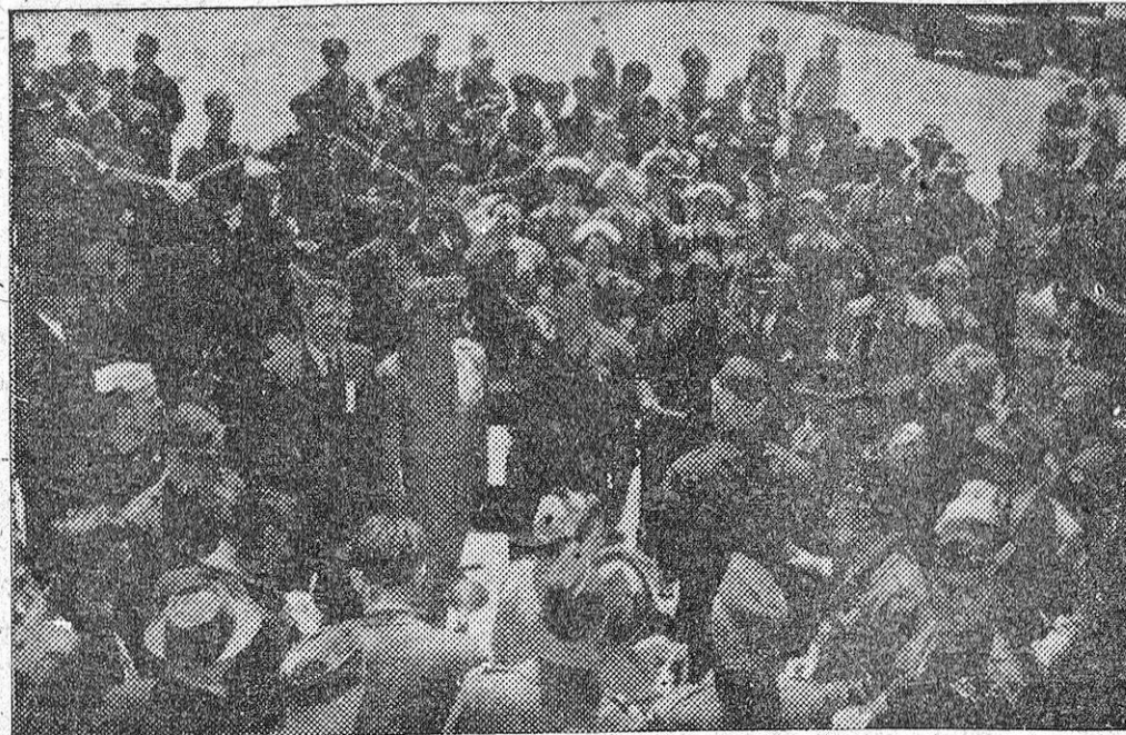
El general Mark W. Clark, jefe de las fuerzas aliadas en Italia, poco después de su llegada a la ciudad de Chicago.

El regreso de Clark a los Estados Unidos