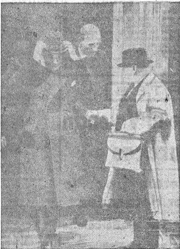
A la salida del último Consejo Supremo franco-ingles, se saludan los dirigentes de ambas naciones. En primer término, Paul Reynaud y Daladier. Les siguen lord Halifax y Chamberlain.

El Ejército alemán había liquidado Polonia, y un Cuerpo armado comenzó la ofensiva para aniquilar Francia. ¿Cuál era el plan del Alto Mando alemán? En mayo de 1940, la Wehrmacht estaba integrada por 190 divisiones. Una masa de ochenta divisiones atacó con sus carros por el Weser, Holanda, Luxemburgo y Bélgica, arrollándolo todo. La invasión se corrió de Sedan a Dinant por las Ardenas. Las panzer avanzaban por doquier. El día de la invasión—10 de mayo de 1940—, sin declaración de guerra, avanzaron por comarcas neutrales los carros, en total 10 divisiones de carros y setenta de infantería. El Mando alemán decidió romper la brecha por Holanda (Maastricht) y tomar el Canal Alberto por sorpresa, todo ello con fuerzas motorizadas. El Ejército belga, en desorden, se retiró, inundando el terreno y retrasando el avance germano. Bélgica tenía 23 divisiones, que podían jugar