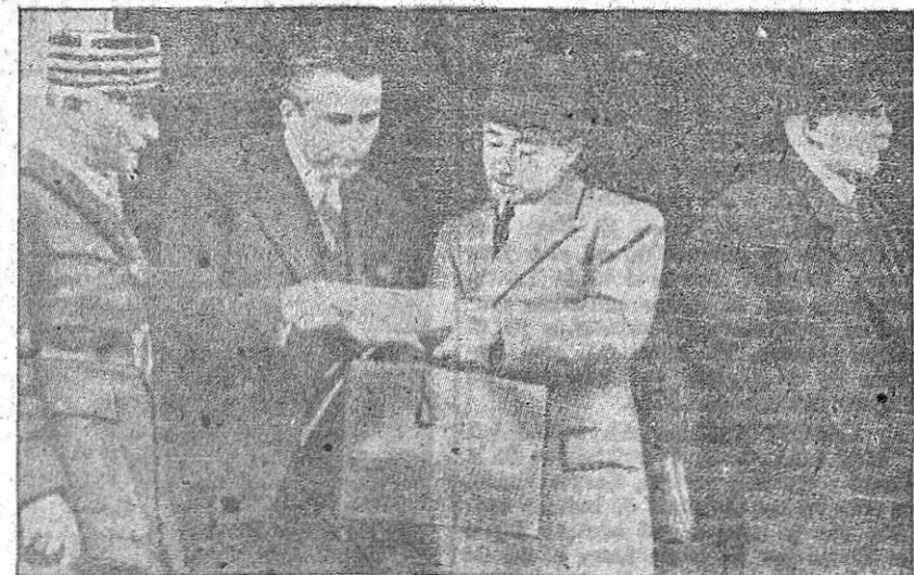
Ante la gravedad de la situación, Reynaud convocó un Consejo extraordinario, quedando después reformado el Gabinete. En la fotografía, el momento de la salida de la reunión, apareciendo Weygand, Reynaud y Pétain.

Tres divisiones de reserva del Meuse y otras a la izquierda del Corap. Estas divisiones estaban formadas por viejos reservistas y era el ejército más deficiente en mandos y armamentos. Su moral era deplorable. Y defendían Sedán, puerta de Francia. El mariscal Pétain había dicho ante la Comisión de