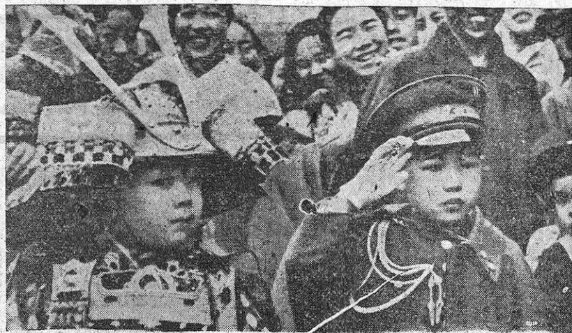
Muchachitos vestidos de "sumarai" y de militar recorren las calles de Tokio ante la admiración de los transeúntes.

Esta guerra ha traído, a la hora ancha de la paz, una principal experiencia que ha costado demasiada sangre: el fracaso de la megalomanía, el abatimiento de los sueños disparatados y las embriagueces del poder, la enseñanza