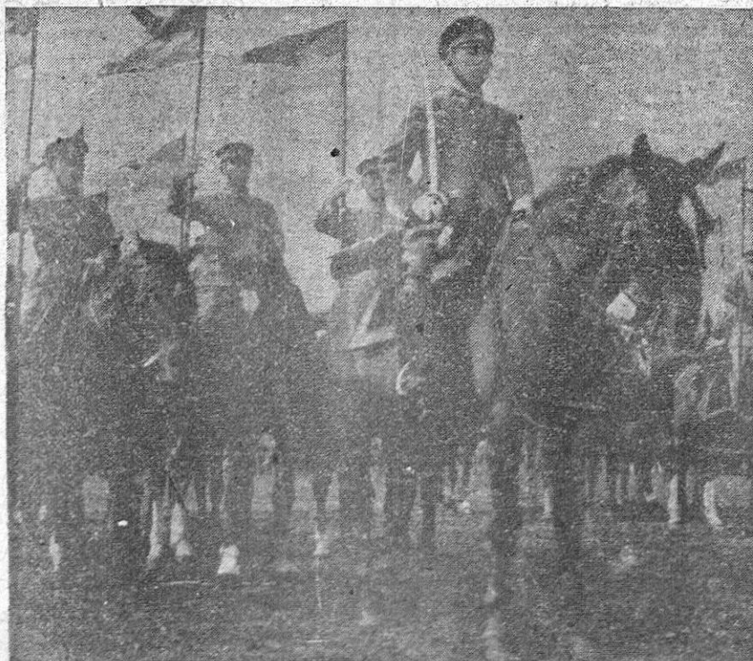
La Guardia Imperial japonesa, escogido íntimo Cuerpo constituido por representantes de las más antiguas familias. De ella provienen los mejores oficiales del Ejército japon.