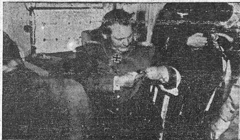
El mariscal alemán, Hermann Goering, durante los trámites de redacción de su expediente de detención, en Auganburgo.

Vi esto que me impresionó profundamente: dos oficiales alemanes (el uno ciego y Caballero de la Cruz de Hierro), a quienes la capitulación había sorprendido de paseo, intentaban, discretamente, tomar una calle secundaría para volver, acaso, al hospital. Un golpe de gente joven, ciega de entusiasmo y alegría, se paró al uno del otro, al pasar. Otros manifestantes, también a la carrera, les distanciaron más. Vi, desde lejos, cómo el ciego extendía silencioso los brazos como queriendo palpar algo mientras el otro braceaba entre la multitud y gritaba, inútilmente, en alemán: «¡Auxilladie! ¡Es ciego! ¡Es ciego!» Nadie oía más que el concierto de su alegría propia. Bregué por llegar hasta él, pero antes una muchacha (seguramente la primera persona danesa que se percató del caso), y de la que no recuerdo más que la melena de ámbra suelta al aire cálido de la tarde primaveral, saltó de su bicicleta, se llegó al caballero alemán de la Cruz de Hierro y, cogiéndole del brazo, le acercó al borde de la acera ante el respeto de los que se dieron cuenta de lo que pasaba y esperó con él hasta que llegó su compañero. ¡Ojalá vencedores y vencidos se dieran pronto la mano como