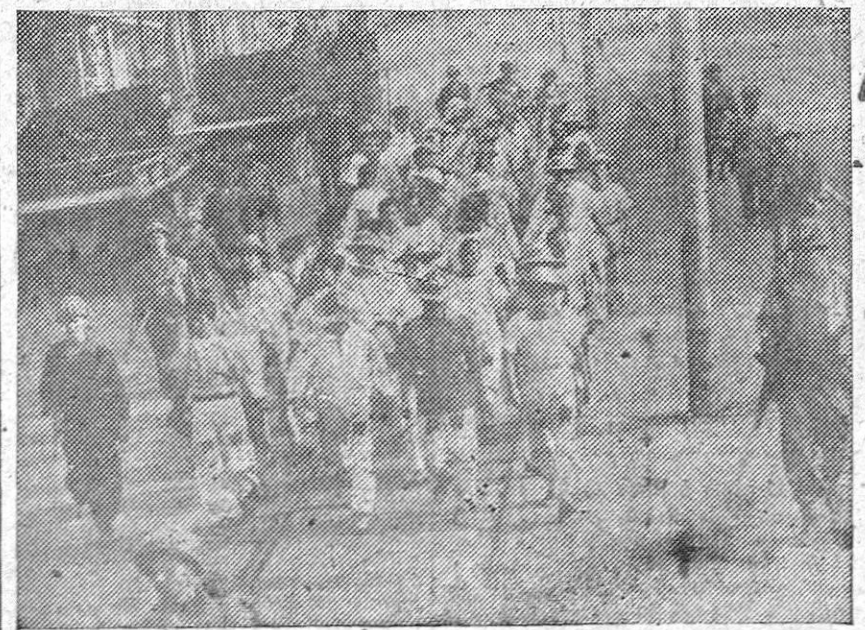
Vigilados por policías militares norteamericanos, prisioneros de guerra japoneses se dirigen a descombrar las ruinas de la capital filipina.—(Foto WHITE).