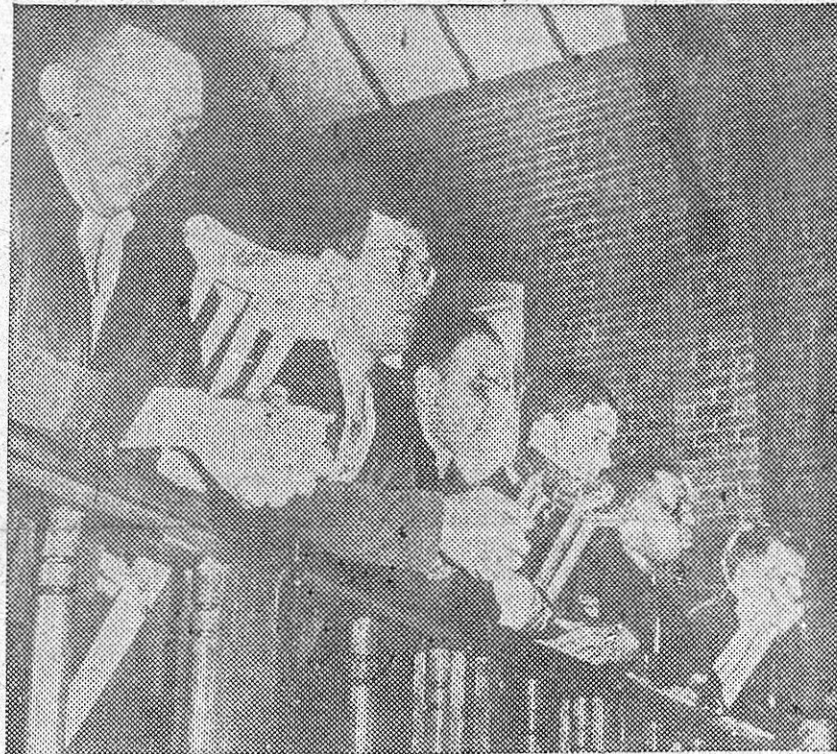
Combatientes americanos heridos se arrodillan a rezar en la capilla del hospital donde se encuentran, al tener noticias de la rendición de Alemania.