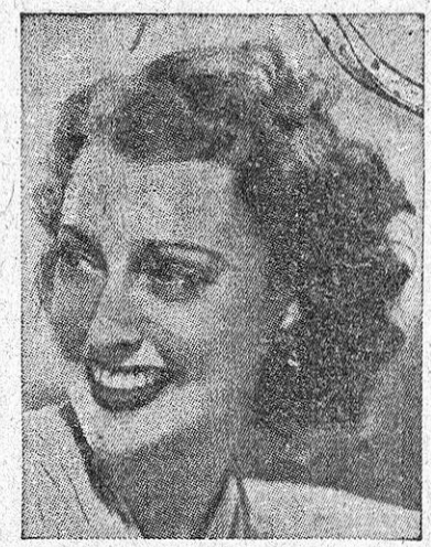
JEANNETTE MAC DONALD

Durante la reciente guerra, por fortuna ya terminada, los artistas cinematográficos de Hollywood no regatearon su esfuerzo en pro de la victoria de las Naciones Unidas. Las estadísticas han revelado ahora que las actividades de las primeras figuras interpretativas de la pantalla, en relación con el conflicto,