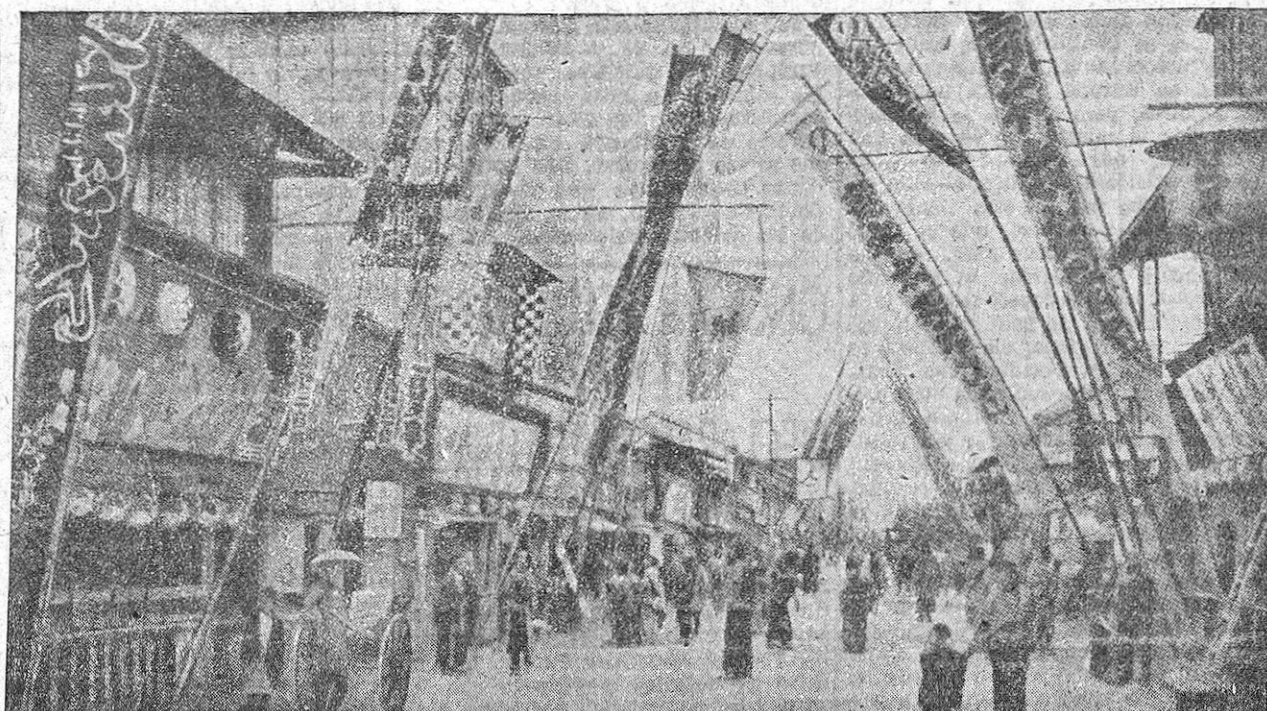
Una calle típica del viejo Tokio, capital del Japón.

En el Japón el erupto no es una grosería sino un cumplimiento. Embriagarse no es vergonzoso. El ataque a traición es ciertamente honorable, casi tanto como el «harakiri» (que ellos no llama «harakiri» sino «seppuku»). Los colores rojo y negro, son colores de júbilo y en cambio el blanco es color de duelo. El número 13 no les dice nada, pero el 4 y el 49 son fatídicos. La condición civil de la mujer se conoce por el cinturón. La edad de las personas se computa por la fecha de concepción y no por la de nacimiento. Beben caliente en verano (la taza de té es correcto beberla en tres sorbos). Los verbos de su idioma son impersonales y los substantivos no tienen género ni número. Su disciplina voluntaria no admite comparación con nada. Carecen de idea abstracta del