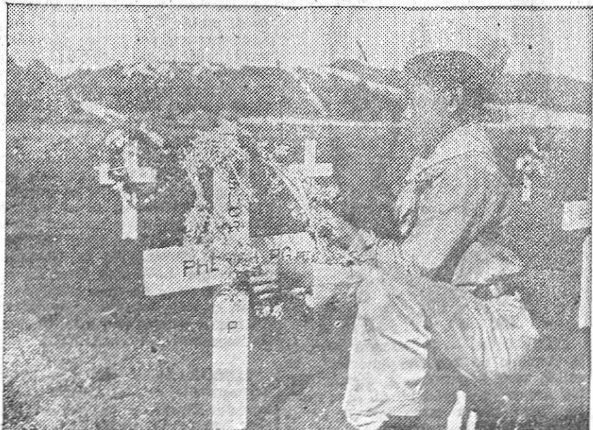
Un año después de que las fuerzas norteamericanas desembarcaran en Guam el 20 de julio de 1944, para dar comienzo a la liberación de la isla, un "boy-scout" chamorro coloca una corona sobre la tumba de un soldado norteamericano muerto al establecer la cabeza de puente en la isla.