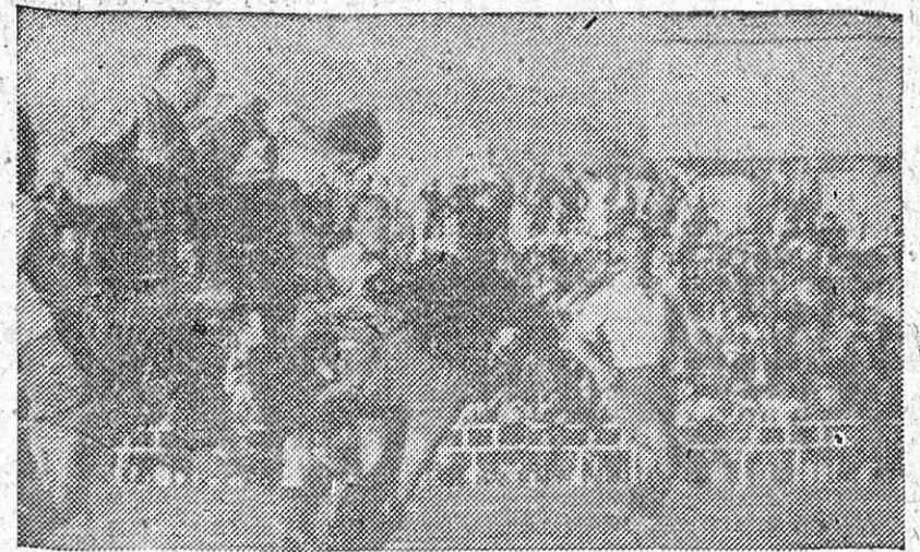
El segundo gol del Granada, marcado también por Trompi.