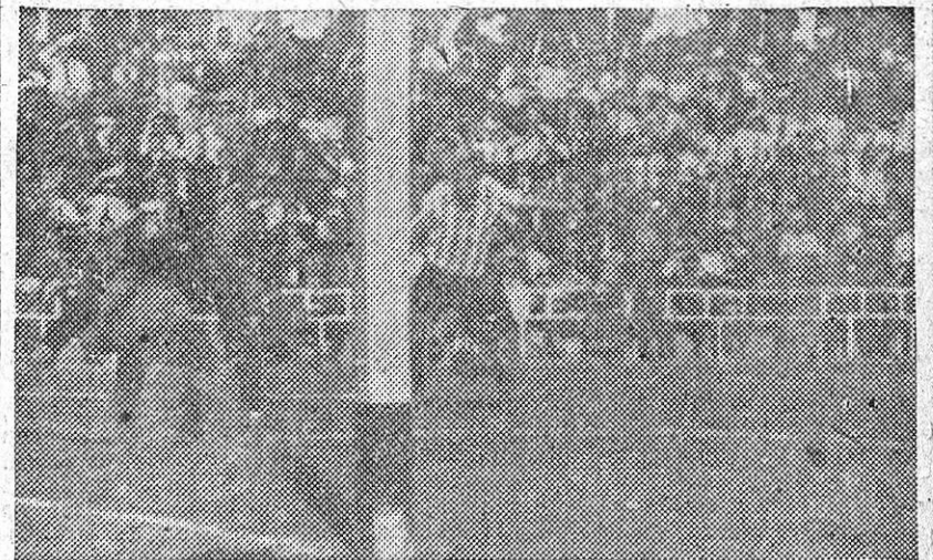
Marín se lanza en busca de la pelota que hará entrar en la red con la ayuda de Safont.