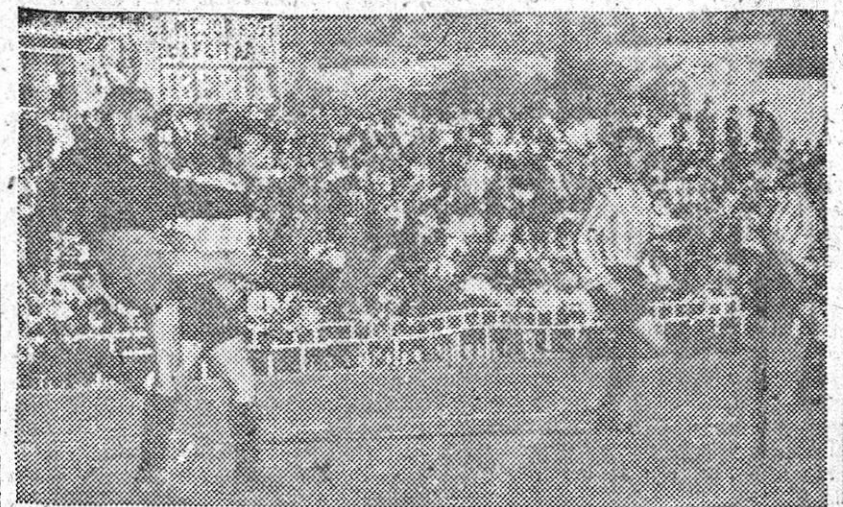
Un momento de apuro ante el marco aragonés.