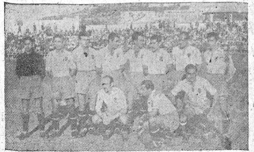
EQUIPO DEL ZARAGOZA

EL LIBRO DE LA FAMILIA expone una gran garantía para todo trabajador con derecho al Subsidio Familiar. La obligatoriedad de su presentación para percibirlo impide al cobrarlo toda suplantación de persona. ¡Trabajador! Por ello debes sustituir cuanto antes tu antigua Declaración de Familia por el actual Libro de la Familia.