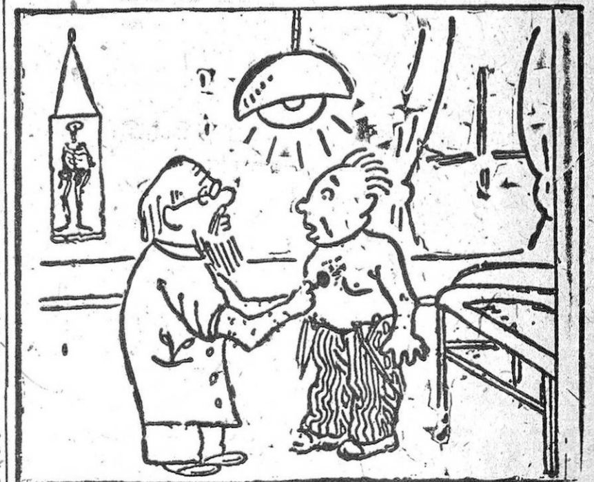
EL DOCTOR.—Vamos, no le dé reparo. Enséñeme la lengua. EL PACIENTE.—La tengo muy sucia, doctor. Soy locutor de radio y me da miedo a poner verde a España todos los días.