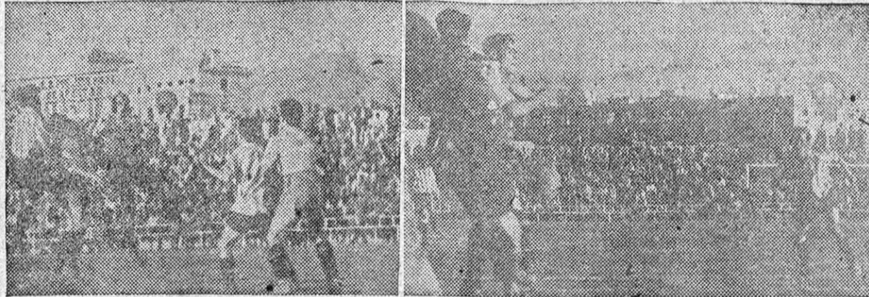
La delantera granadina, que se empleó con coraje en algunas ocasiones, sostuvo toda la tarde un fuerte duelo con la enérgica pareja defensiva aragonesa. Dos momentos de peligro ante el marco de Calvo, resuelto a su favor por Juande Valle.

Los aragoneses se mostraron muy rápidos y derrocharon brío y entusiasmo en la pelea TROMPI (2) Y MARIN MARGARON POR EL GRANADA Y MARIANO HIZO EL GOL FORASTERO