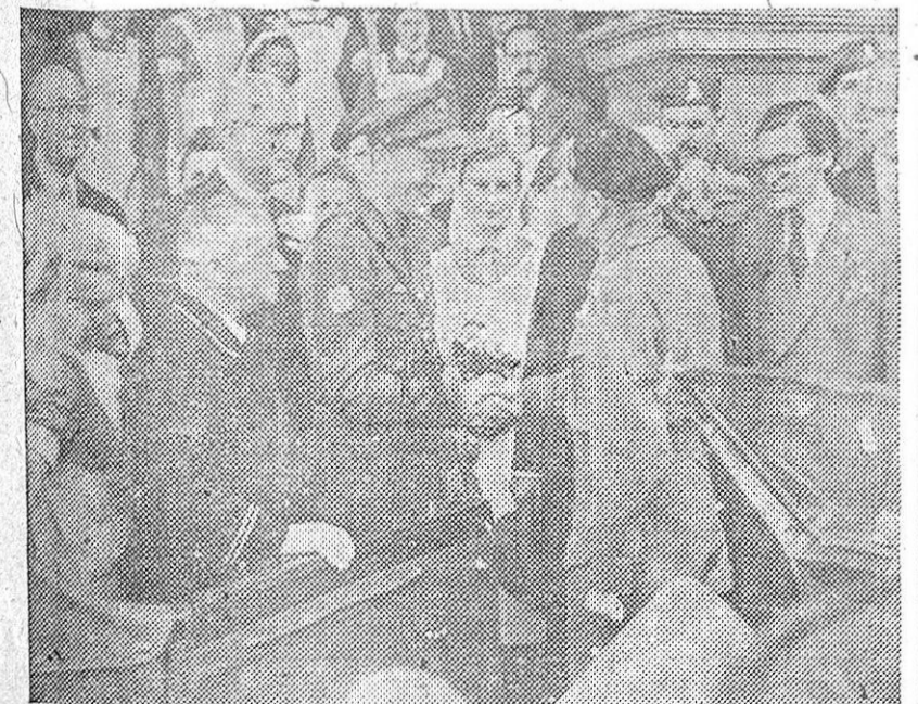
El mariscal de campo Montgomery saluda al príncipe Bernardo de Holanda, durante su reciente visita oficial a La Haya.