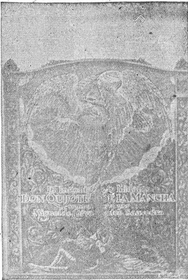
He aquí una de las bellísimas páginas del manuscrito titulado y policromado del "Quijote", iniciado por don Pío Cubanas Font.

Cervantes vendió "La Galatea" al editor Blas de Robles, en 1.336 reales. El "mercader de libros" le entregó 1.086, y antes de abandonar la casa del escribano levantaron acta de que le quedaba debiendo los 250 restantes.