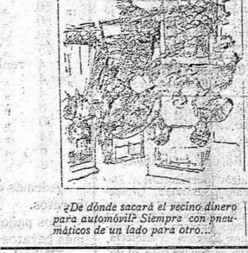
¿De dónde sacará el vecino dinero para automovil? Siempre con neumáticos de un lado para otro...