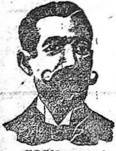
COSTANZI 284, Diputación, 284 BARCELONA

Almacenes y escritorio: Plaza de la Universidad, 4