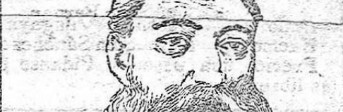
Goremynkin Presidente dimitionario del Consejo de ministros de Rusia