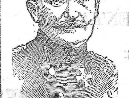
General von Bessler

La actitud expectante en que se encuentran colocados los Ayuntamientos de Granada y sus pueblos es de lo más extraño que se registra.