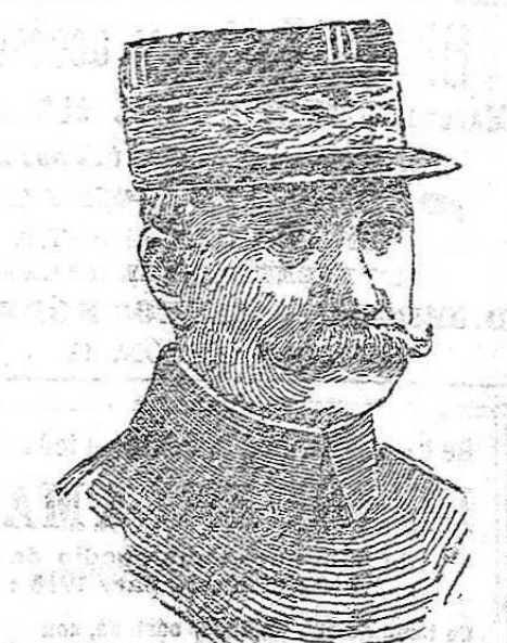
El general Petair, comandante en jefe del ejército francés, defensor de Verdun