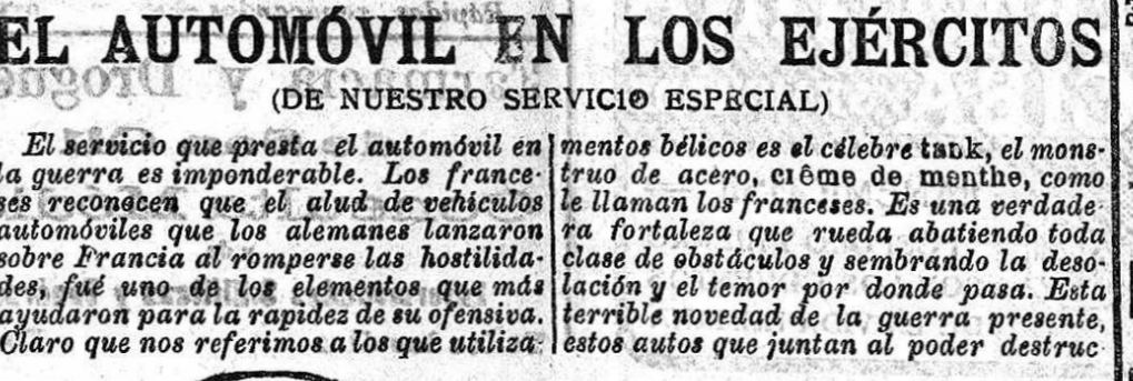
Los automóviles blindados de la guerra actual

(DE NUESTRO SERVICIO ESPECIAL) El servicio que presta el automóvil en la guerra es imponderable. Los franceses reconocen que el uso de vehículos automóviles que los alemanes lanzaron sobre Francia al romperse las hostilidades, fue uno de los elementos que más ayudaron para la rapidez de su ofensiva. Claro que nos referimos a los que utiliza-