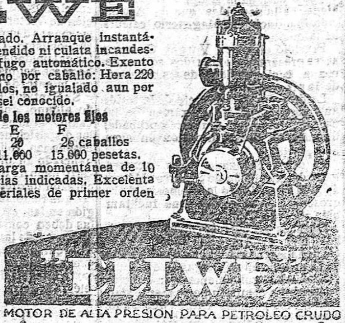
MOTOR DE ALTA PRESION PARA PETROLEO CRUDO