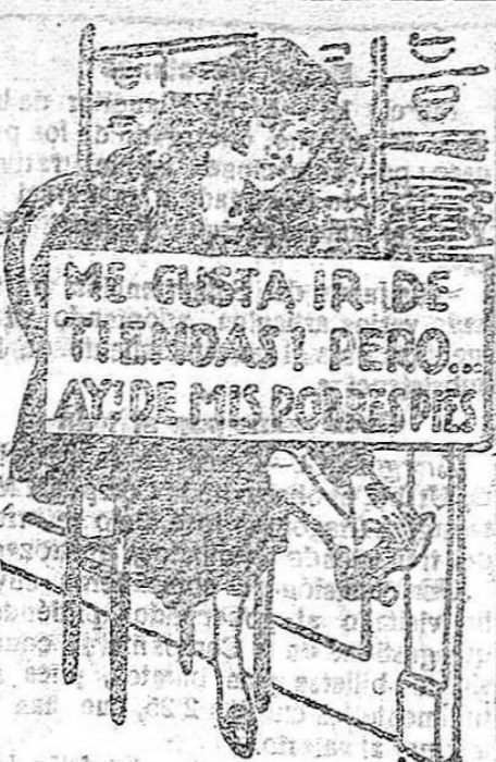
Tal es la lamentación constante de los hombres y mujeres

A la música secular y emocionante andaluza que matiza el ambiente local de Granada, le ha salido una berruga: el fonógrafo.