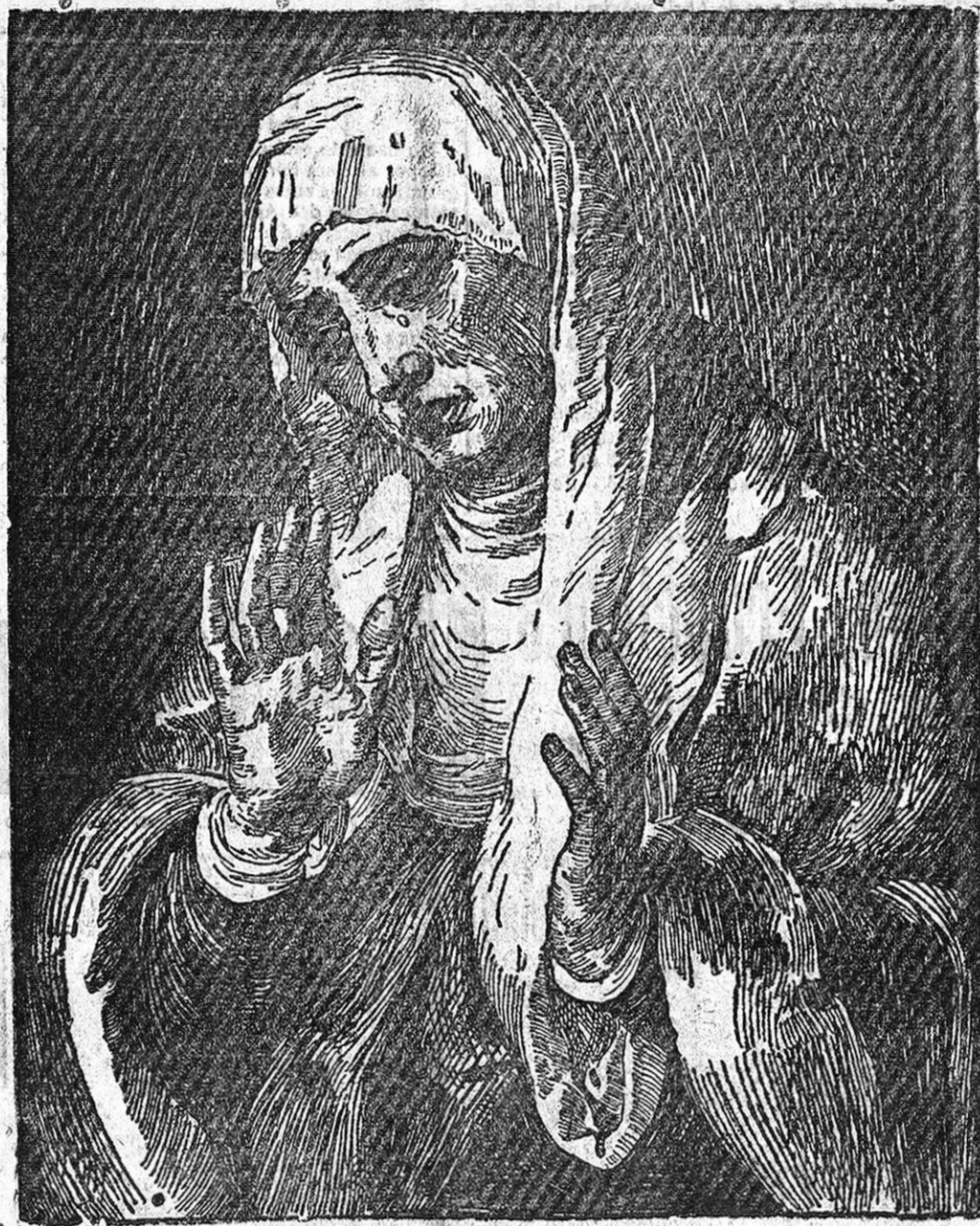
VIRGEN DE LA SOLEDAD de Tiziano, que se conserva en el Museo del Prado (Madrid)