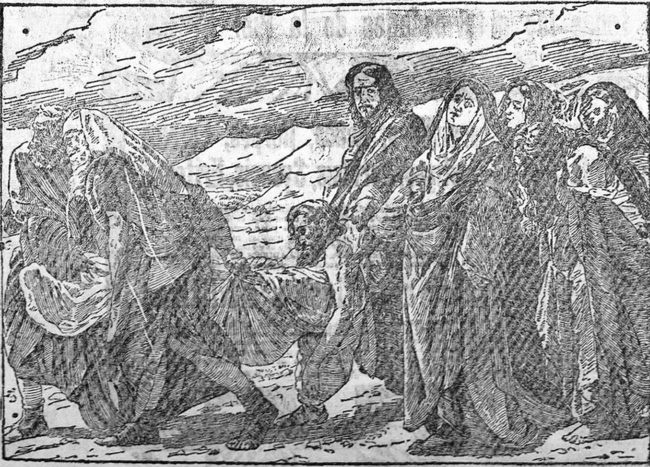
ENTIERRO DEL SEÑOR