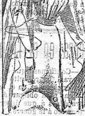
Traje para novia

Para la confección de este traje úsase la tela llamada piel de seda . Se compone de un cuerpo á pliegues, los unos á lo largo del cuerpo, que se reoegen en la cintura y los otros transversales sujetos á un bonito roseten de ful colocado en el delantero. Sobre el hombro izquierdo se coloca una cinta de seda formando lazo. Cinturón de seda, falda lisa y velo de gasa.