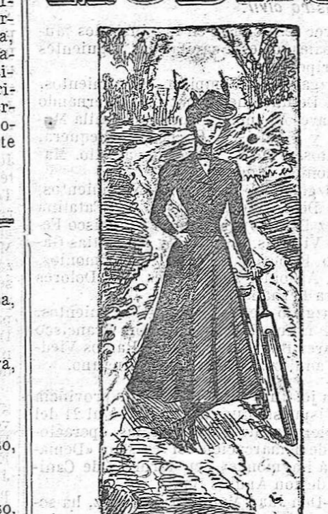
Traje para señora ciclista

Se confecciona con alpaca de color azul, y se compone de un cuerpo en forma de chaqueta ajustada, abrochándose en el delantero. Pechera planchada y cuello de caballero con las puntas dobladas. Corbata negra, de seda; sombrero hongo con pluma al lado; falda corta; medias de seda negra y zapato escotado.