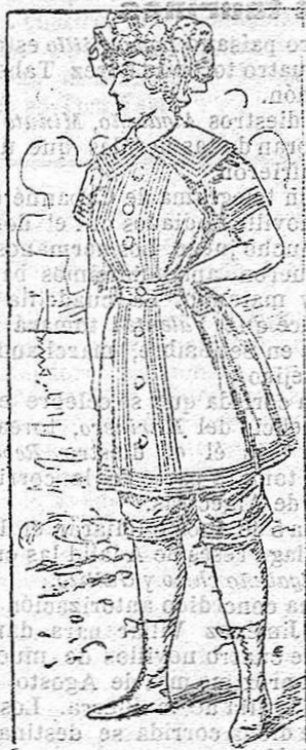
Traje para baños

El airoso traje que, para baño, representa el presente dibujo, se confecciona con franela de algodón, color azul marino. Se compone de una blusa con amplio cuello vuelto, adornado, tanto este como el resto de la blusa, por trenzillas blancas, colocadas á lo largo del delantero y en el borde de lo que forma la falda. Mangas cortas con igual trenzilla en el borde. Esta blusa se abrocha por delante con seis botones de nacar, ajustándose al talle por un cinturón de la franela indicada. Pantalón á media pierna con trenzilla en los bajos.