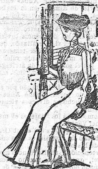
El último figurín

Vestido para viaje, tan bonito como sencillo. Chaqueta suelta adornada con multitud de botones del mismo color del vestido. Manga estrecha y abierta á la mitad. Falda con trencilla y botones al lado izquierdo.