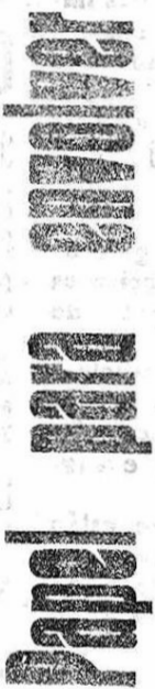
En la imprenta de este periódico, Granada