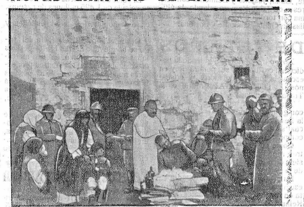
MEDICOS RUSOS ASISTIENDO HERIDOS EN MACEDONIA