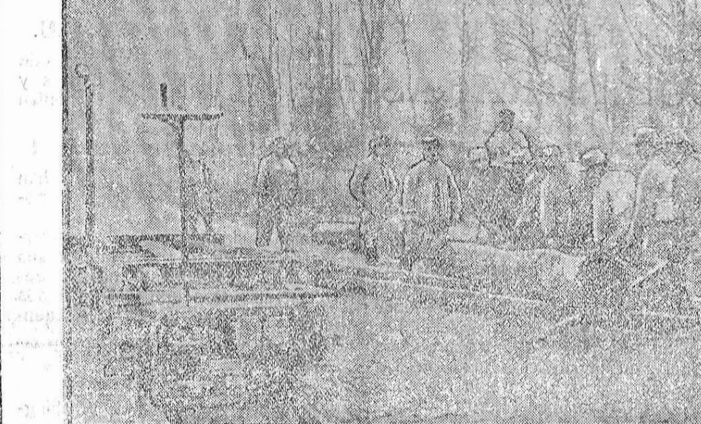
TRANSPORTE DE MADERAS CON DESTINO A TRINCHERAS FRANCESAS