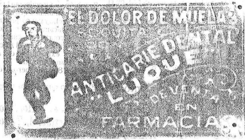
PRECIO DEL TUBO, UNA PESETA DE VENTA EN LA FARMACIA SUEIRO, GRAN VIA, 13