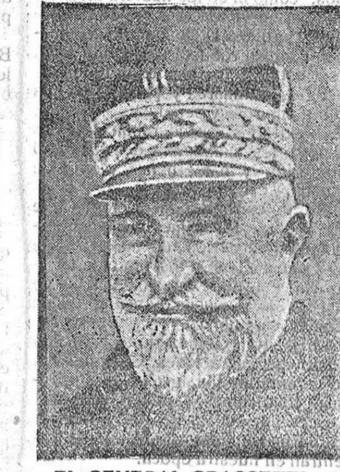
EL GENERAL GRASSETTI.

se yo que queriendo aprovecharse de las circunstancias, al pagar el gasto hecho en un tupi más ó menos intoxicador, han entregado al mozo un duro tan sumamente malo que el hombre, pareciéndole peor que un dolor de costado, se ha visto precisado á decir al consumidor. —Caballero, este duro es falso. —Ya lo sé. —Hombre, ¿y sabiéndolo me lo ha dado usted á mí? —Claro está. Y usted lo cambia y en pez. —¿Y cómo voy á cambiarle siendo un duro malo? —¡Qué preguntas! ¿No sabe usted que en Carnaval todo pasa? Todo pasa, si, caro lector; es verdad. Y que pase todo poco debe importarle á nadie. Lo único que si importa, y eso porque si pasa sin ser Carnaval, es el tiempo; sobre todo si se le deja pasar sin aprovecharle en algo útil, que es lo que yo, desgraciadamente para los que tienen la santa paciencia le leerme, hago. Y si nó véase la muestra. ANGEL PALANQUES. Miércoles 21-II-917.