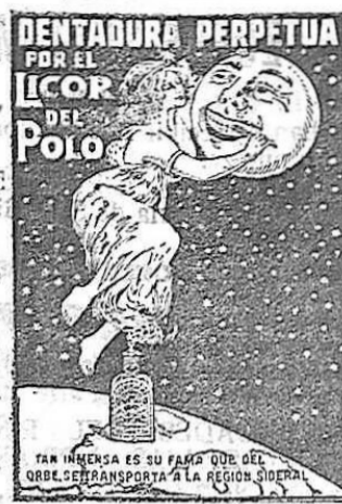
DENTADURA PERPETUA POR EL LICOR DEL POLO

De la acreditada casa de LUIS SANCHEZ APONTE Y COMP. a , Granada