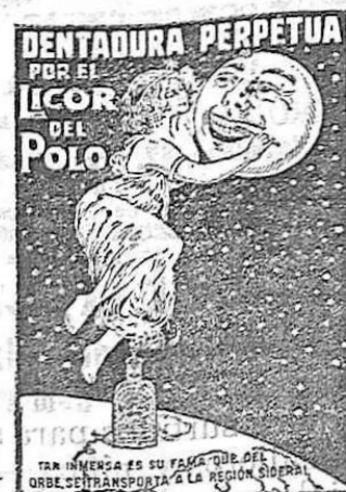
DENTADURA PERPETUA POR EL LICOR DEL POLO