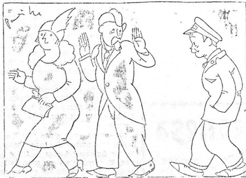
—Si los señores quieren, puedo acompañarlos y enseñarles la población. Poco doce lenguas.

Los detenidos han sido puestos a disposición del Juzgado de instrucción, buscándose al capitán de la cuadrilla, que ha desaparecido.