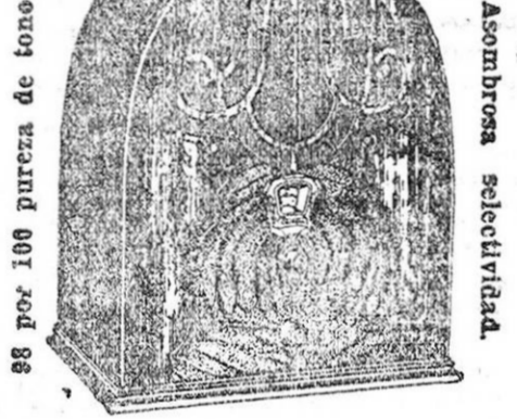
Superheterocino ultra moderno. Válvulas MULTI-MU y PENTODO