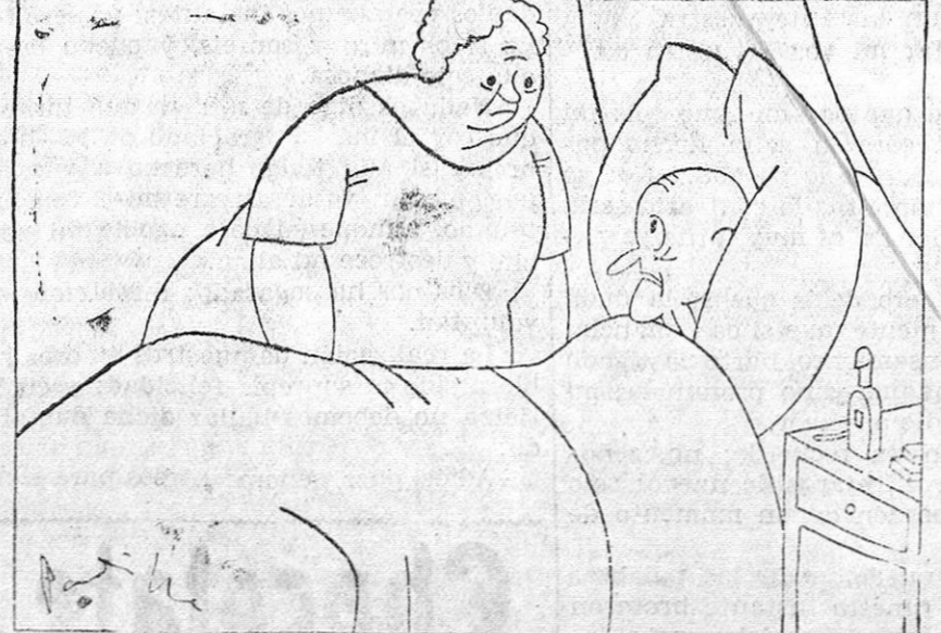
EL MARIDO SE MUERE Y HACE TESTAMENTO:

SEÑORAS.—No hay salda donde se sirva mejor a las señoras que el de Muñoz Hnos., Plaza de la Mariana.