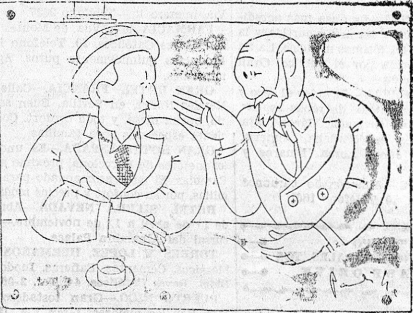
—Yo conocí a mi mujer tres meses antes de casarme. —Pues yo conocí a la mía ocho días después de casado.

«EL PAJARO AZUL». — Merendero. Vinos y Licores. Junto a Aviación. (Llanos de Armilla).