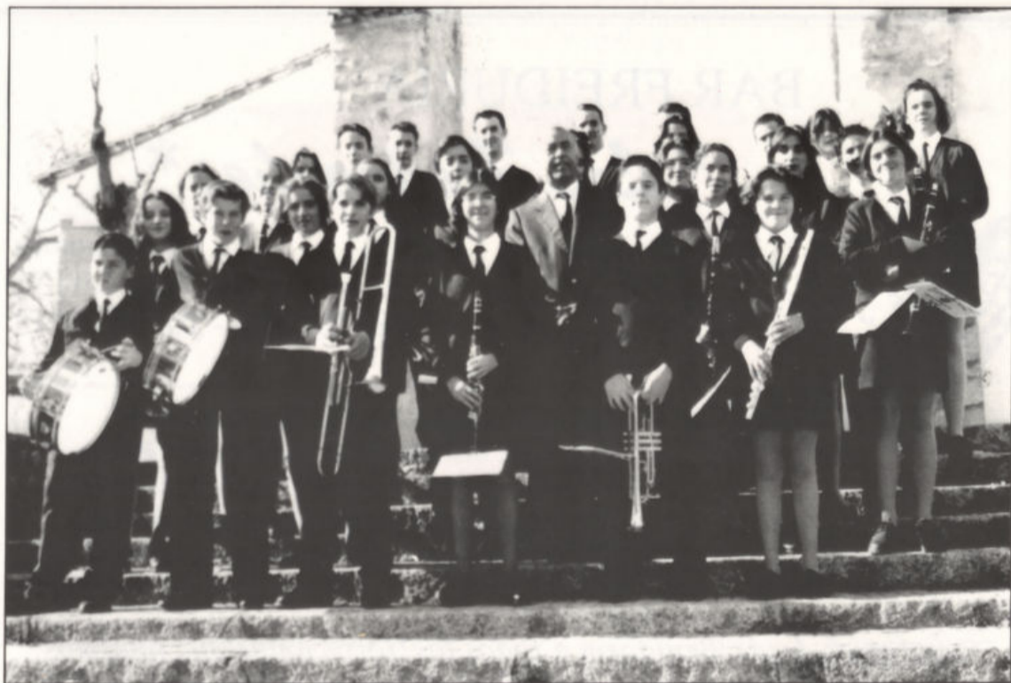
Componentes de la Banda de Música