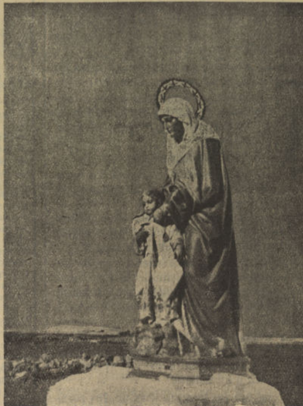
SANTA ANA, PATRONA DE EL VISO

Diversos y variados espectáculos de todas clases.