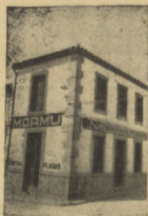
San Isidro, 1. Tel. 64 POZOBLANCO