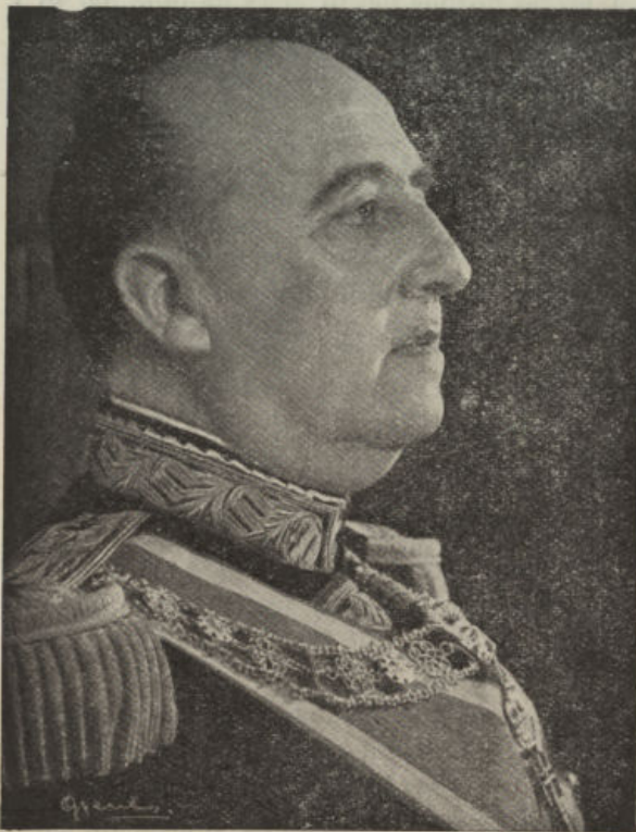
Francisco Franco, veinticinco años al frente de la Jefatura del Estado. Serenidad, claridad de juicio, voluntad sin fallos, lucidez, prudencia, ideas claras del interés nacional. EL CRONISTA DEL VALLE hace votos por la salud, el bienestar, la pujanza y aciertos de S. E. el Generalísimo al celebrar sus Bodas de Plata con la Jefatura del Estado

Hoy, en las efemérides gloriosa del XXV Aniversario de la Exaltación de Francisco Franco a la Jefatura del Estado, es conveniente traerlo al recuerdo. Porque Franco ha sido el forjador de una España en paz y orden, de una España fecunda, por lo cual todos los españoles, sin distinción de matices, le debemos profunda y filial gratitud.