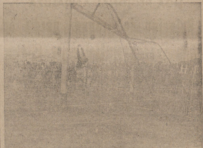
Un buen despeje de puños del meta tarraconense a un tiro de Sierra. El balón dió en el larguero.