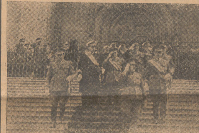
El ministro del Ejército y otras autoridades militares, saliendo de la iglesia de los Jerónimos, de Madrid, después de la solemne misa en honor de San Fernando, Patrón del Arma de Ingenieros.