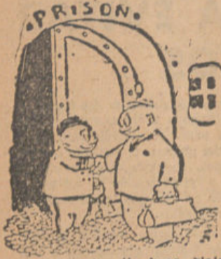
—Adiós. Que tengáis buen viaje y que volváis pronto a hacernos una visita.