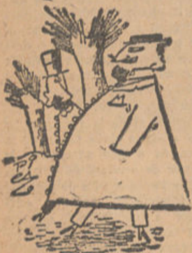
—¿Cómo te encuentras, Pepe? —No lo sé; no me he buscado todavía.