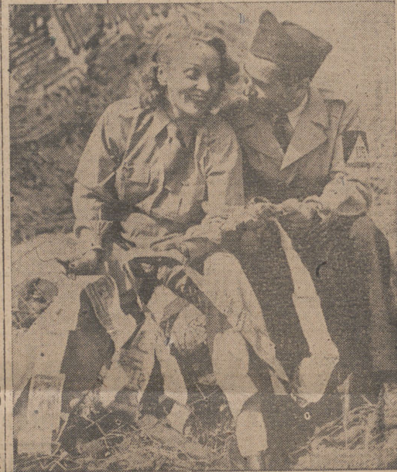
Marlene Dietrich durante su visita a un campamento de soldados norteamericanos, durante la pasada contienda.

La famosa "vampiresa", transformada en una danzarina oriental por arte del maquillaje