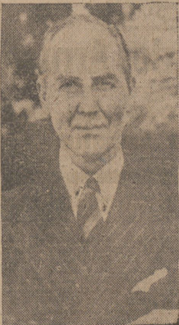
Sir Allan Cunningham, alto comisario británico en Palestina.

Para cuando se constituyó el "Mandato", ya había empezado la inmigración hebrea hacia Palestina. Más de 35.000 judíos habían llegado a la Tierra Santa. Después, y a un ritmo creciente, la colonización sionista creó en grandes pro-