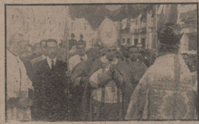
Un grandioso recibimiento tributó el domingo la ciudad de Antequera al señor obispo de Málaga doctor don Ángel Herrera que asistió a la clausura de una asamblea de Acción Católica. (Información, en páginas centrales.)