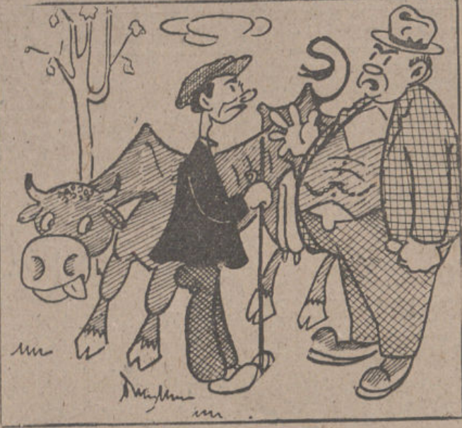
—De verdad, compadre, no me interesa la vaca. Está tan delgada, que en vez de solomillo tiene "sólo hueso".