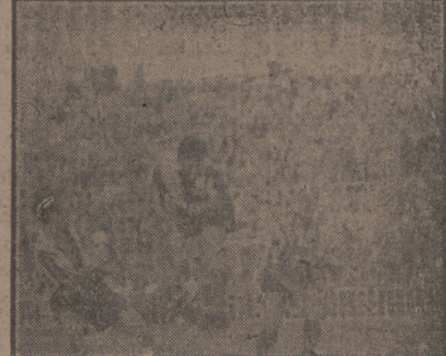
Pastor, interior del Hércules, marcó el cuarto de la serie de un magnífico cabezazo. "Al por", Arce. (Foto NIETO).