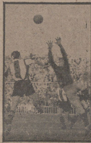
Por cinco goles a dos perdió el domingo el Granada frente al Hércules, en el magnífico estadio de Bardin, de Alicante. Una intervención de Casafont, apoyado por Castiella, el impetuoso delantero centro herculano que tuvo una gran tarde. (Foto NIETO).