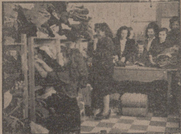
Camaradas de la Sección Femenina justificando la ropa y prendas de abrigo recogidas estos días con destino a la "Campaña de Invierno", que patrocina el Jefe provincial del Movimiento y Gobernador civil.

En España y en todo el orbe cristiano, la Navidad es la fiesta más íntima, la más recogida y hogareña. En esos días se celebra el Nacimiento del Señor y se rinde homenaje a las tradiciones y sentimientos familiares. Estos sentimientos familiares, por recatados e íntimos que sean, trascienden a la calle, parece que se respiran en la atmósfera de las plazas y paseos. Una alegría sana y fresca, una alegría inconfundible envuelve en esas fechas a todas las ciudades cristianas. En Navidad, decimos, y con esta palabra expresamos sensaciones y sentimientos peculiarísimos que conmueven la raíz más oscura de nuestro ser. Queremos decir muchas cosas con esa palabra, pero ante todo queremos decir una, que a todas abarca: amor. Es fiesta de amor, de comprensión, de generosidad. Jesús ha nacido. Para el cristiano el nacimiento de Jesús significa el nacimiento del amor, del desprendimiento, de la caridad. En esa fecha se olvidan las rencillas, se aplacan los odios y el amor se expande por calles y plazas y se concentra en torno al fuego, en el hogar, junto a los hijos y los deudos más ancianos.