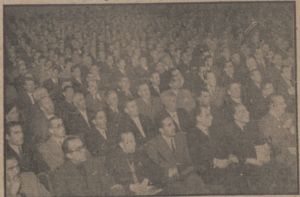
Aspecto que ofrecía la sala del teatro Madrid en la sesión inaugural de la II Asamblea nacional de Hermandades de Labradores, que ayer dió comienzo en la capital de España bajo la presidencia del ministro de Agricultura, don Carlos Rejn.—(Foto LANDBAUER).

Pronunció su discurso inaugural el ministro de Agricultura, camarada Rejn