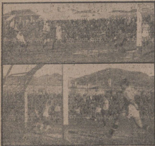
He aquí dos de los ocho goles que encajó el Atlético Malagueño en Los Cármenes, en su partido del lunes con el Recreativo de Granada.