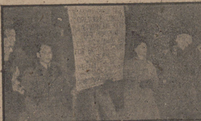
Maridos ingleses que tienen a sus esposas en Rusia, de donde no les permite salir el Gobierno soviético, se manifiestan a la puerta del hotel donde se hospeda Molotov, en Londres, pidiéndole a éste el inmediato regreso de aquéllas.