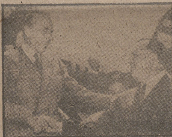
NEUVA YORK.—El conde Folke Bernadotte, ya de regreso en Palestina, fotografiado a su llegada al aeródromo de La Guardia, para informar a la O.N.U.