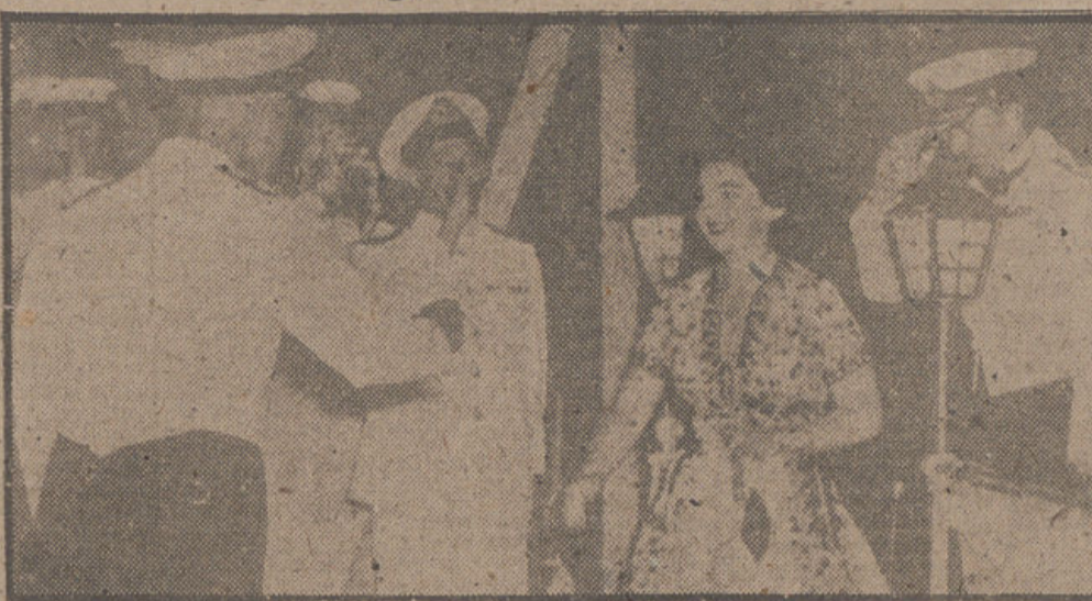
ATENAS.—SS. MM. los reyes de Grecia, visitan el crucero almirante inglés "Liverpool", anclado, con una escuadra inglesa, en El Pireo.