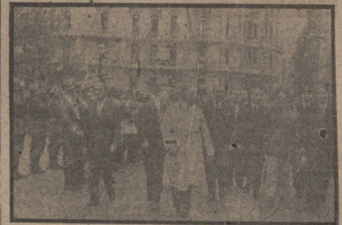
El ministro español de Asuntos Exteriores, señor Martín Artajo, revista, entre las ovaciones del gentío, a las tropas que le rindieron honores ante la catedral de Buenos Aires, donde asistió a una solemne función religiosa con motivo de la fiesta de la Hispanidad.

Diez millones de kilos de aceite serán exportados a Francia