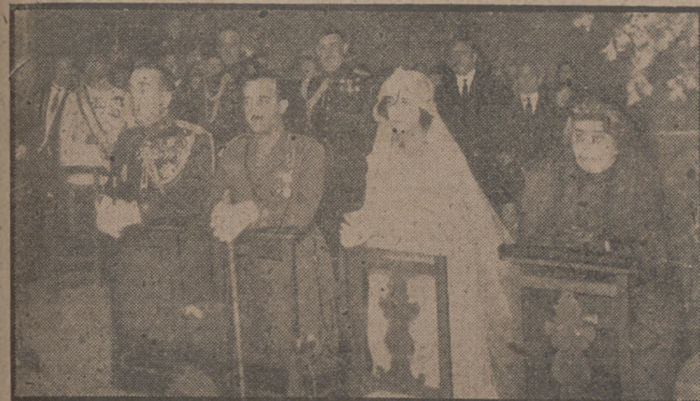
Una fotografía que se ha hecho históricamente a la llegada de Su Excelencia el Jefe del Estado al palacio de El Pardo, acompañado de su esposa, y con motivo de la celebración de sus bodas de plata. En la iglesia ovetense de San Juan, de cuyo acontecimiento se ha cumplido ahora el XXV aniversario.

MADRID, 22 (CIFRA). — Los exportadores de aceite de oliva han celebrado una reunión en el Sindicato del Olivo, ultimando la exportación a Francia, conforme fue establecido en el tratado de comercio con este país, de diez millones de kilogramos de aceite de oliva.