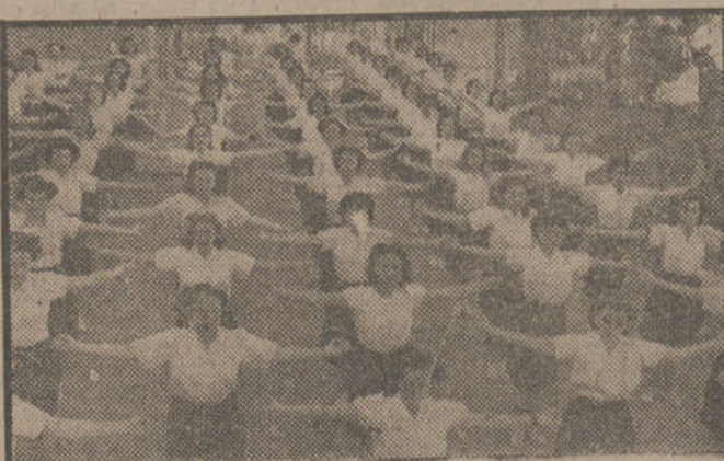
Las maestras de primera enseñanza que están realizando el curso de instructoras de "Hogares y juventudes" de la Sección Femenina, en la Escuela de mandos de la carretera de Santa Fe, durante la clase de gimnasia.—(Fot. SANZ).