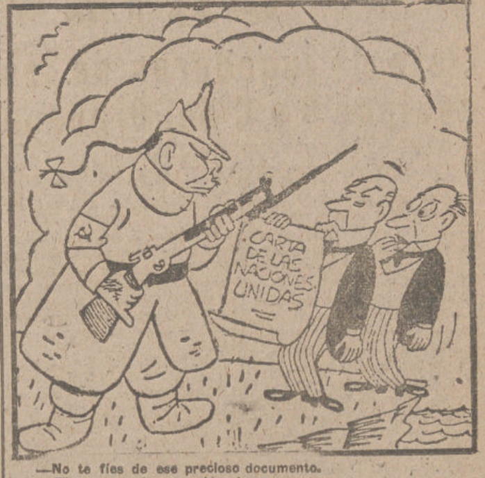
No te fíes de ese precioso documento. Tiene cara de no saber leer.