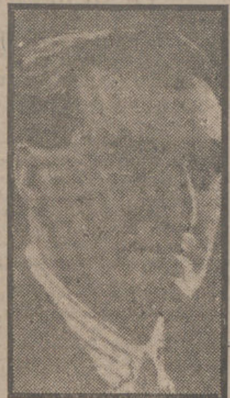
Don Emilio Sagi-Barba, el gran cantante español, que acaba de fallecer en su retiro de Polop (Al cantle).—(Fot. R.MOS).